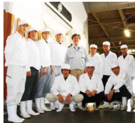
今年の酒造りの蔵人！

い日本酒アワード」金賞。天寿燻上がり純米酒は「燻酒コンテスト」ぬる燻部門最高金賞など沢山の賞を頂く事が出来、大変嬉しく思っています。 さて、今年の県産米は残念ながら期待ほど収量は無く、出穂後の積算温度が一〇〇〇度を遥かに超え、心配された高温障害も出て割れやすく味が辛い米です。 その様な状況ではありますが、10月15日から蔵人が入り始め、22日には全員入蔵し全力の清掃に入り、26日には予定通り初蒸しを行いました。 百四十周年を迎える酒が初挑戦の新人杜氏ですが、根を詰めて計