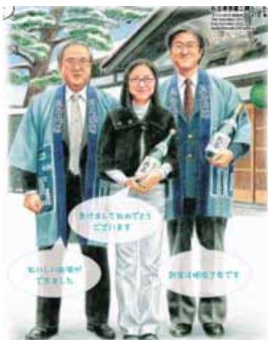
秋田県・県政だより「かだろ」新年号表紙 で親子三代がイラストで紹介されました。

市町村合併により、阪神淡路大震 災で叫ばれたコミュニティを大 切にする方向とは真逆の方向に走 り続け地方のコミュニティの崩 壊を促進し、無資源国では不安傾 向は止めようも無く日本はどんど ん貧乏になり、目先の対策しか行 なれない農業は梯子を外された 状態で疲弊し続け、近い将来に見 える食糧不足の時にはそのつけが 跳ね返ってくる事が目に見える様 です。 ここ十年の金融再生を中心とし た中央経済復興中心の政策の結 果、地方の変化は大変厳しいもの があり、人口の減少・財政の悪化 は大変深刻な状態になりました。 その様な中、天寿酒米研究会と の原料米契約栽培の強化、製造技 術向上の為に精米所・醗酵タンク 等の設備投資、蒸し米や麹の質向 上の為の設備改善、ビン貯蔵のた めの冷蔵倉庫の建設、花酵母の研 究を含む新商品開発、地域の人々 と共に進むための各種イベントの 開催、小人数体制への移行等弊社 も必死に変革の努力を続けてまい りました。 しかし、国内における日本酒の 消費量はピーク時の半数を割り、 底無し沼のようにその先行きは見