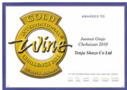
インターナショナル・ワイン・チャレンジでいただいた賞状です。

九月初旬、出張で移動中に友人 からの電話で「今ミヤネ屋見てる？ 凄いね新首相が天寿飲んでるん だあ。」何の事かと確認したらテレ ビで新首相の特集をして、地元で 良く行く秋田料理の「かまくら」さ らで、天寿本醸造を来られる度に 四合以上飲んで頂いている酒豪と の報道だったとの事。 苦節12年の社長業ですが、「これで 天寿も伸び始めるか!？」と思っ てしまふほど、恵まれてきたと勘違 いしたくなるようなサプライズが 続きました。