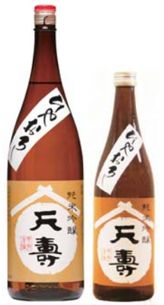
720ml 1,350円（税別） 1800ml 2,700円（税別）

東京農大花酵母研究会の「なでしこ酵母」を使用し、弊社自慢の天寿酒米研究会契約栽培米酒造好適米で醸し上げた、香り高くふくらみのある味わいのお酒です。この時期にしか味わえない旬の逸品をご賞味下さい。