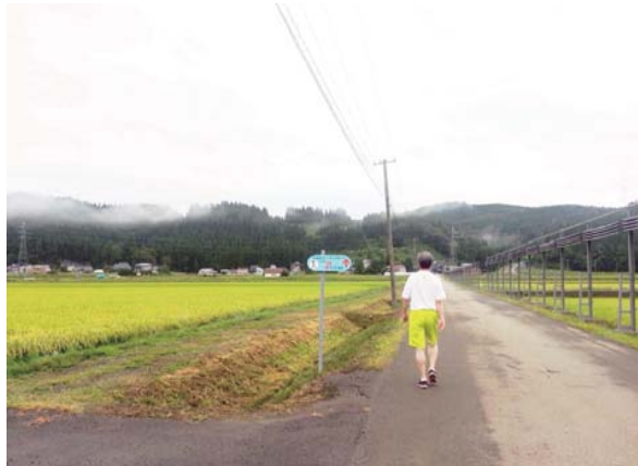
秋の田んぼを歩く4か月目のウォーキング。

天寿酒造株式会社 〒015-0411 秋田県由利本荘市矢島町城内字八森下117 TEL 0184-55-3165 FAX 0184-55-3167 http://www.tenju.co.jp 第96号 2015年9月号