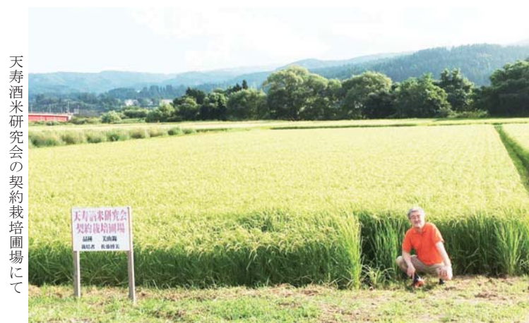
天寿酒米研究会の契約栽培圃場にて

くくなりました。親の様でもあり、汗を流して応援する高校生と同じ様でもあり、先生になったりコーチになったり先輩になったり隣のおじさんになったりと、まあ忙しく心が躍り、声を上げ、涙をふき、手に汗を握る興奮の日々が続きました。決勝翌日の地元秋田魁新報は、なんと号外を含めて十六ページの記事を出しました。たいしたものだと思います。全国最速の人口減少県に久々の喜びの大ニュースでした。それにしても暑い夏が続きます。連続の台風・ゲリラ豪雨等の異常気象が悲しい事に当たり前になってきました。予報は色々出ていますが秋田県南部は今のところ特に被害はなく、稲の成長も平年通りと聞いております。しかし、この暑さですので高温障害が出る可能性は高いと思われるます。田んぼ毎に品質のバラツキが出ると、どのコメがどのような状態なのかなど、確認や調整に非常に困難な対応が求められるのです。何しろ米が溶けなくなるので浸漬や蒸米等々で様々な対策をとるのですが、何をやってでも思う様にならないという年もあるのです。