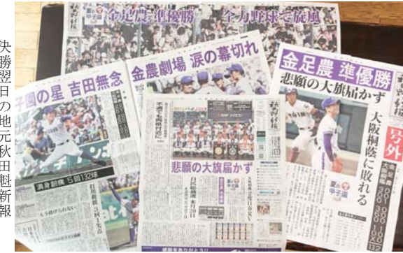
決勝翌日の地元秋田魁新報

天寿酒造株式会社 〒015-0411 秋田県由利本荘市矢島町城内字八森下117 TEL 0184-55-3165 FAX 0184-55-3167 http://www.tenju.co.jp 第114号 2018年9月号