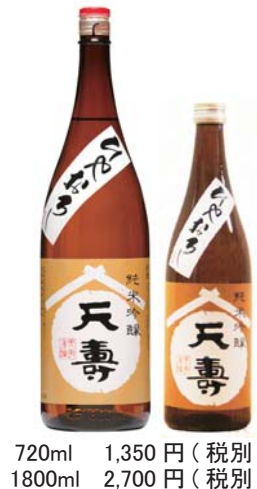
720ml 1,350 円（税別） 1800ml 2,700 円（税別）

大好評発売中！季節限定酒 純米吟醸「天寿」ひやおろし 東京農大花酵母研究会の「なでしこ酵母」を使用し、天寿契約栽培培酒造好適米美山錦で醸し上げた、香り高くふくらみのある味わいのお酒です。旬の逸品をご賞味下さい。